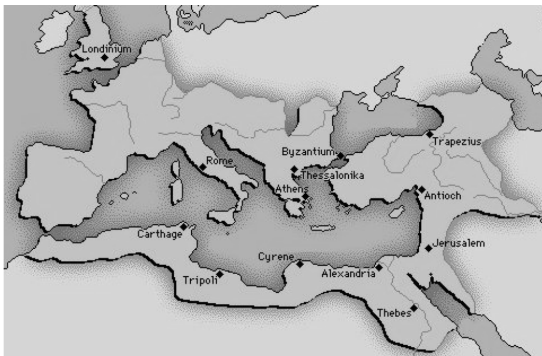
Het Romeinse Rijk in de eerste eeuwen van onze jaartelling

In dit volksgrieks is dus het NT geschreven. Het was naast het Aramees de tweede taal van veel mensen in Israël. We vinden daarom veel Hebraïsmen en Semitische zinsconstructies in het NT. In de laatste les vind je daarvan een aantal voorbeelden. In deze Basis cursus zal - indien nodig - gewezen worden op het verschil tussen het klassieke Grieks (KG) en het Koinè (K).